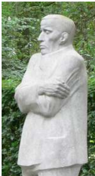
Käthe Kollwitz Vladslo